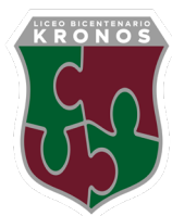
Ilustración de Elizeth Carvajar